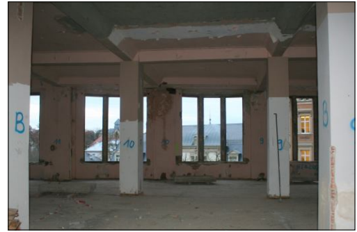
Durchblick Fassade zum Postplatz