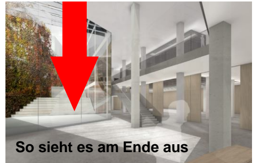
So sieht es am Ende aus

Rote Pfeile = Eingangsbereich im Innenhof