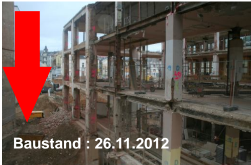
Baustand : 26.11.2012