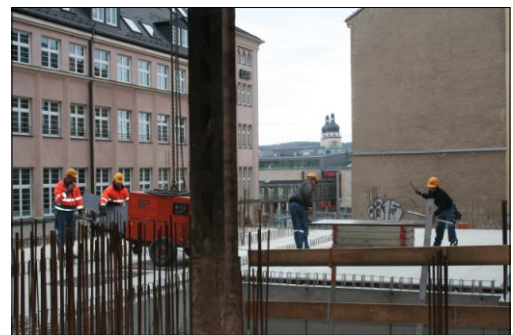
Arbeiten auf der Rohbaudecke Blick zur Forststraße